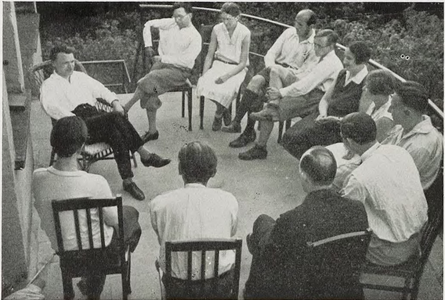
Abb. 6: Teilnehmer des Arbeitskreises im Landhaus der Stiftung in Fischbach