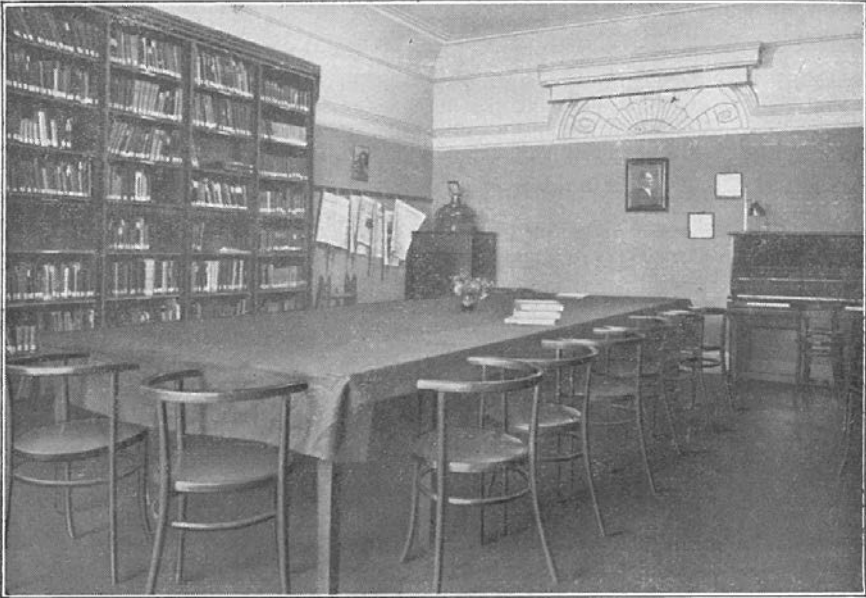
Abb. 3: Arbeitsraum der Dr. Arthur Pfungst-Stiftung