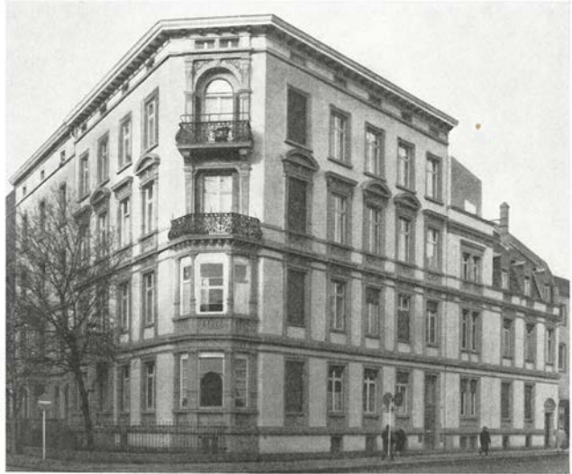
Abb. 2: Haus der Familie Pfungst am Gärtnerweg 2 in Frankfurt, Sitz der Stiftung von 1918-1968