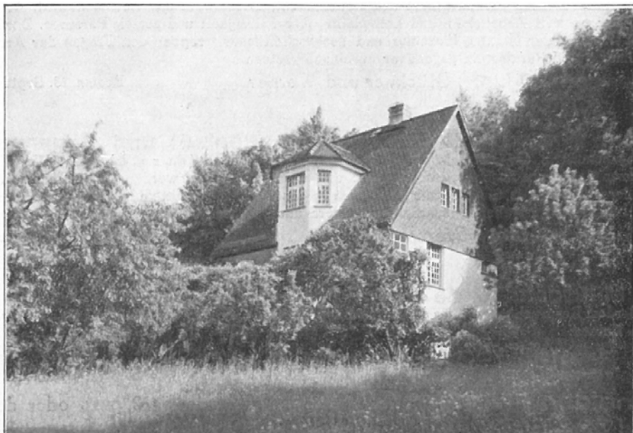
Abb. 5: Haus der Stiftung in Fischbach im Taunus

Seine Ideen und Ideale setzte Werner nun in Frankfurt bei der Pfungst-Stiftung um. Im Programm sind die Ziele der Lehrveranstaltungen wie folgt be-